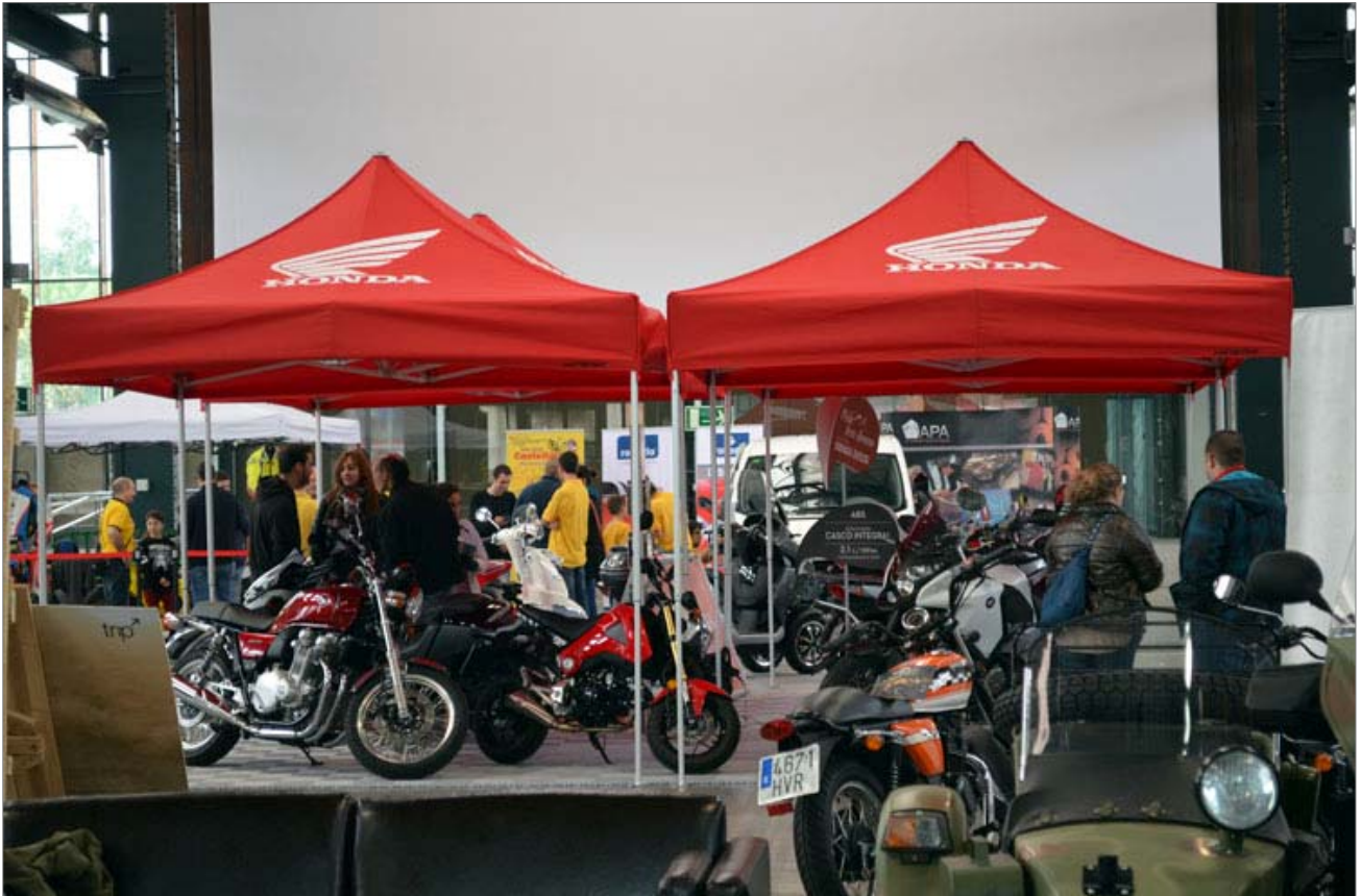
Stand de Honda